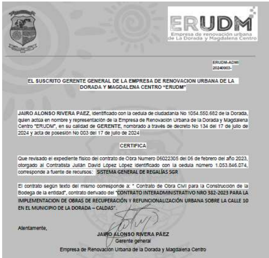
Ilustración 1 Certificación Origen de Recursos ERDUM